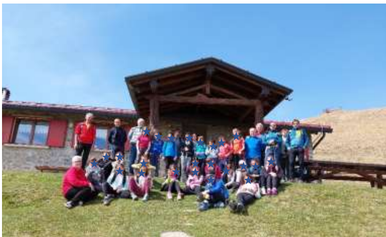
Qui siamo stati accolti con una squisita pastasciutta che ci ha offerto il G.E.P. e poi ci siamo divertiti a giocare e cantare nel praticello.

Infine, discendendo dal monte Alino, siamo ritornati a Parre, sfiniti ma orgogliosi di avercela fatta!!!.. e nel cuore... tanta tanta gioia ed energia!