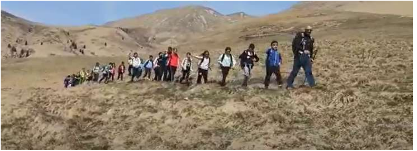
E finalmente eccoci al rifugio Vaccaro!!! (m.1365)